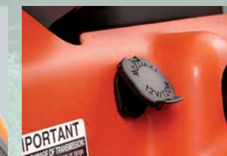
12 V CONTACTDOOS